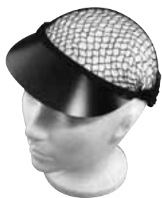
FILET MOYEN À CHEVEUX - rayonne - brun avec visière - 12/paquet FCV