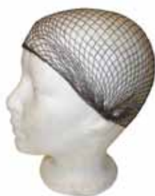
FILET MOYEN À CHEVEUX - 12/paquet brun F224 blanc F224B