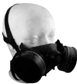
DEMI-MASQUE DE PROTECTION - silicone - grandeur moyenne DEMIM