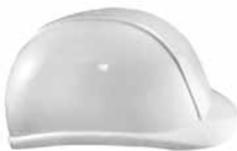
CASQUE DE PROTECTION - plastique blanc - taille unique BC1