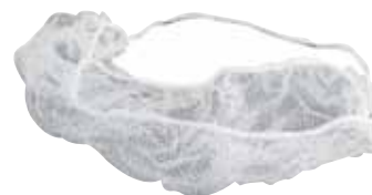
FILET POUR LA BARBE - blanc à l'unité BARBE 100/paquet BARBE/100