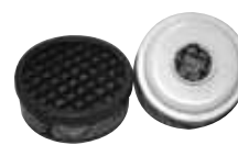
CARTOUCHE DE RECHANGE - pour masque de protection DEMIM - 2/paquet CART