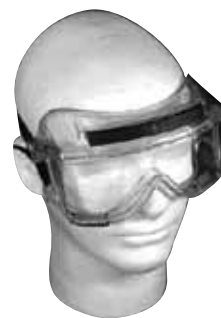
LUNETTE DE PROTECTION LUNETTEP