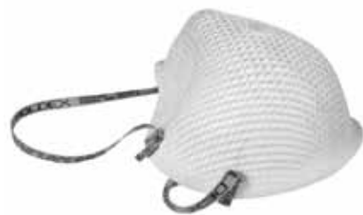
MASQUE DE PROTECTION - 20/boîte MASQUE20