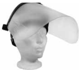
VISIÈRE DE PROTECTION - 8" x 15 1/2" visière VISI serre-tête SERT